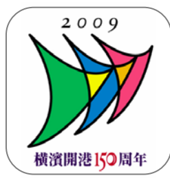
横浜開港 150 周年記念事業ロゴマーク コンセプト

「風を受けて世界へ開く“帆”」をイメージした三枚の帆は、グリーンが企業、ブルーが行政、ピンクが市民を表現し、重なり合う二つの三角は“力”と“融合”を表し、1世紀半におよぶ当地の歴史とそこに培われた進取の気質を織り込んでいます。また、三枚の帆は、色彩を毎年度入れ替えすることにより、その力がより大きく発揮できるようそれぞれの関係を構築しています。