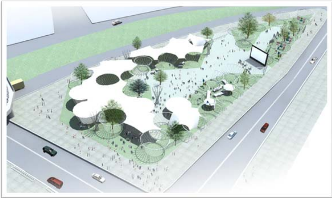
▲Y150はじまりの森（会場イメージ）