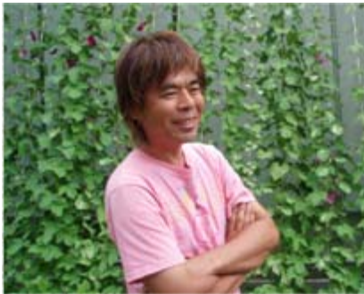
日比野克彦アートプロデューサー (東京藝術大学教授)

～貨客船、地元の漁船、タンカー、コンテナ船～ ～FUNEを創れば、想いは船出し、水平線を越えていく～