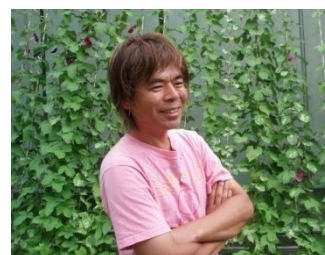
開国博Y150アートプロデューサー 日比野 克彦 (東京藝術大学教授)

これまで横浜市内の市民利用施設や中学校などでワークショップを実施し、残すところ、あとわずか5艘を制作するのみとなりました。この夏休み期間中も、財団法人横浜開港150周年協会と財団法人横浜市青少年育成協会の共催により海洋教室を企画し、船と海について学ぶとともに、「帆船日本丸」の目の前で「帆船日本丸」を制作します。