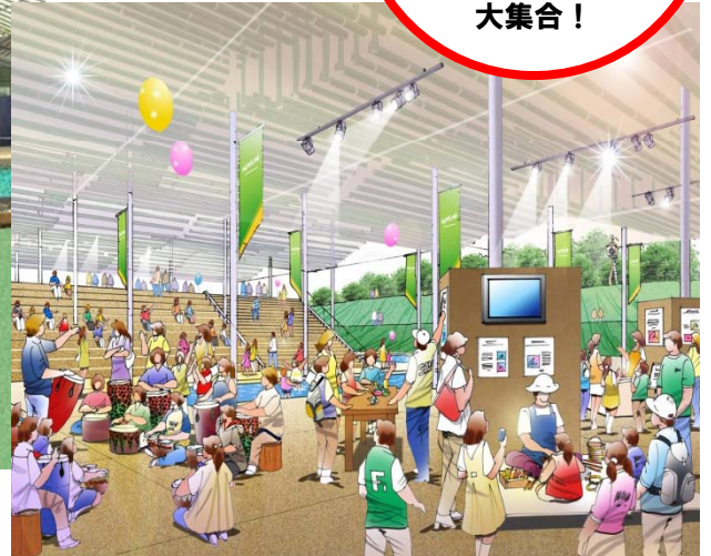
▲市民創発発表（イメージ）

「私からはじめる これからの150年」 をテーマに、 市民が創り上げた 多様な出展内容が 大集合！