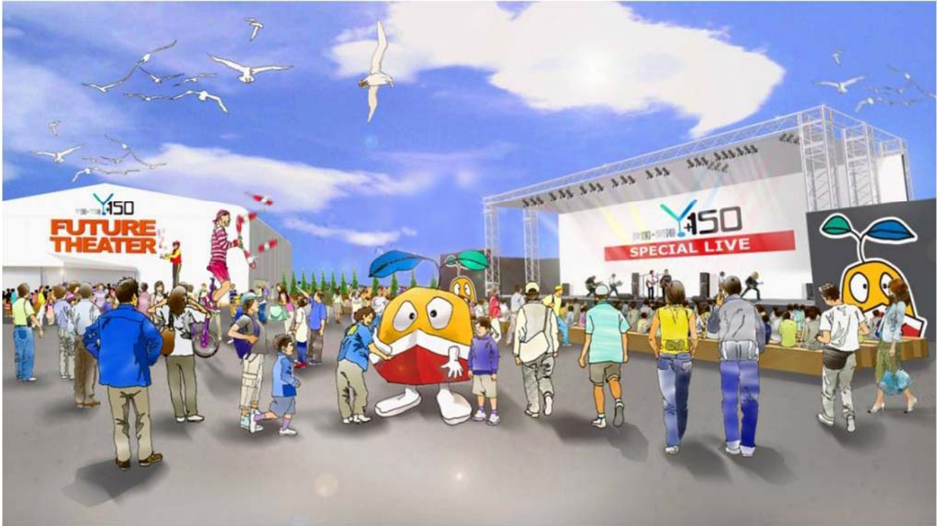
▲新港地区7街区会場(仮称)Y150エンターテイメントゾーン