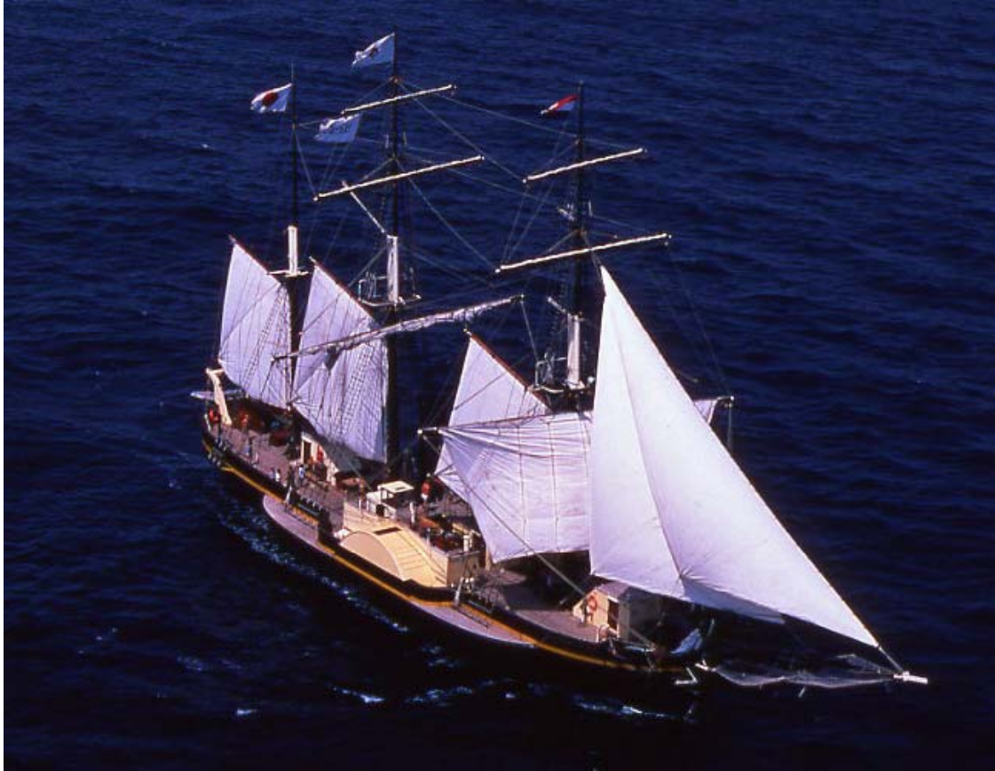
▲山下公園会場(仮称) Y150地域交流ステージに来航する黒船(イメージ)