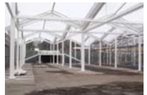
▲鉄板基礎上に鉄骨柱が建つ

環境配慮ポイント… 建築物の多くは、地面に穴を掘ってコンクリートの基礎をつくり、そこに柱を建てます。コンクリートは石灰石がセメントになる際に多くのCO 2 が発生し、さらに運搬時のCO 2 に加え、基礎をつくったり、取り壊したりするときの建設機械を動かすことでCO 2 が発生します。リース鉄板を利用すると、製造時のCO 2 発生を抑えることができ、さらにコンクリート基礎よりも工期が短く、簡便につくることができ、運搬・建設・取り壊しの時のCO 2 発生をより少なくできます。